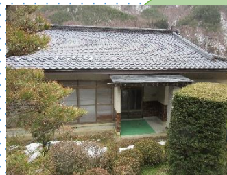
おいでにゃんしょ