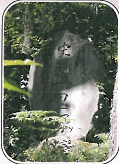
牛首峠 前山の一里塚