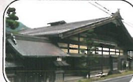
小野宿問屋(旧小野家住宅)