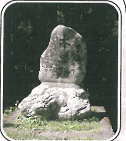
「是より南木曾路」の碑