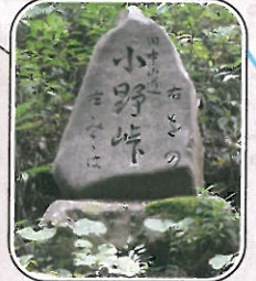
旧中山道小野峠碑