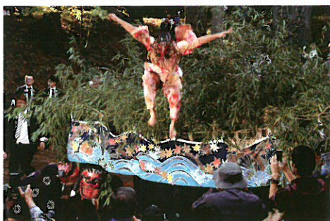
辰野町観光協会長賞「飛んだ天狗」