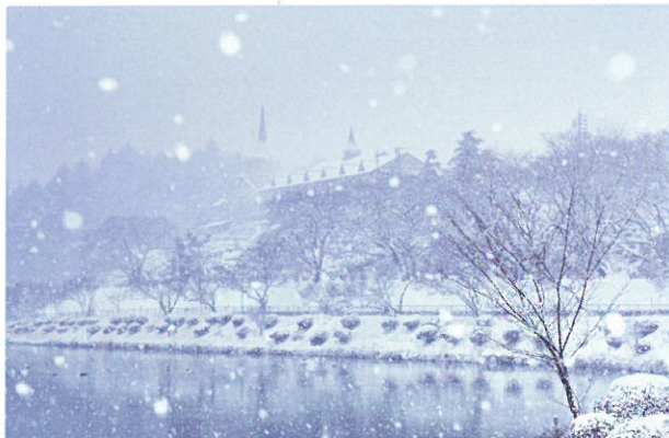
最優秀賞「雪蛍舞うたつの海」