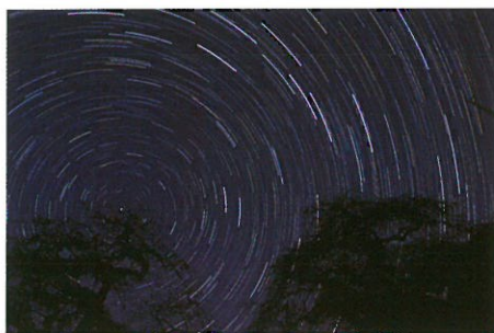
優秀賞「渦巻く星座」