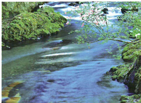
辰野町観光協会長賞「春の横川川」