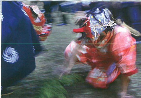
最優秀賞 「一瞬のにらみ合い」