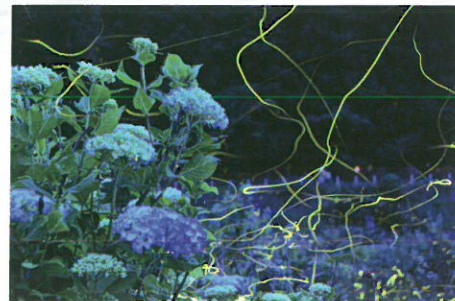
優秀賞 「花と光る時」