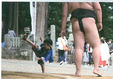
優秀賞 「しこ踏んじった」